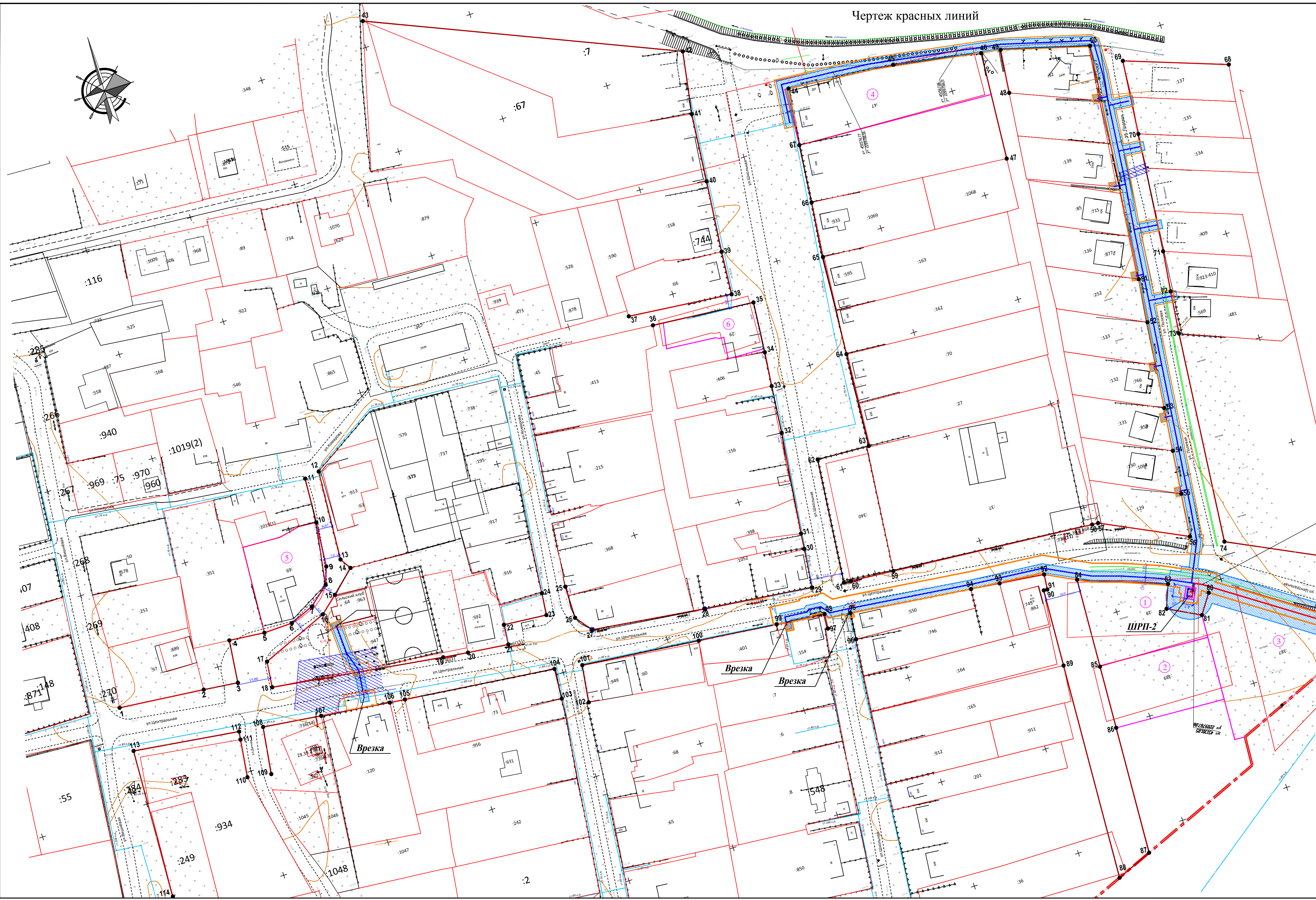
Чертеж красных линий

Изм. №, подл. Поименно и дата Взам. инв. №