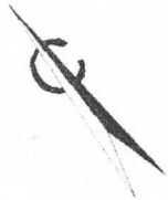
Схема планировочной организации земельного участка. М 1:500