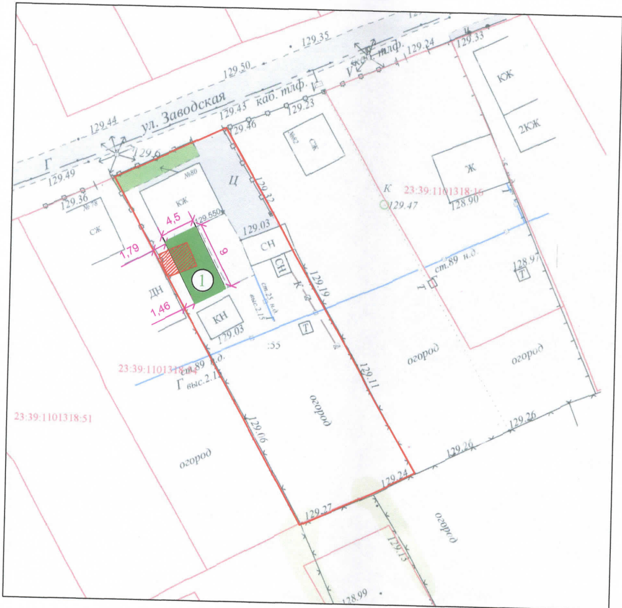
Схема планировочной организации земельного участка